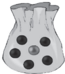
圖 2 評事件機率作業

作業設計主要參照 Tatsis 等人（2008）的作業而來。施測者拿木製轉盤讓幼兒先轉動，然後再由施測者轉動轉盤，問幼兒：「轉盤停下來之後，轉盤上的指針最有可能停在那一個顏色上面？」幼兒的偏誤在以喜歡的顏色決定指針的落點處。