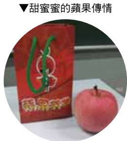
▼甜蜜蜜的蘋果傳情

如果上述活動你都有參與到，會發現每個活動過後都會得到一張神秘字卡，那到底可以做什麼呢？其實這是學生會特別安排的一個活動，蘋果節系列活動最後一個是「蘋果英雄之路見不平；拔刀相助民主法治演唱會」，而收集集字卡會在演唱會上有意想不到的驚喜！凡是任參加五項蘋果節系列活動，集滿「三。八。