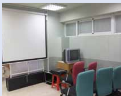
▲可供多人觀賞的播放空間