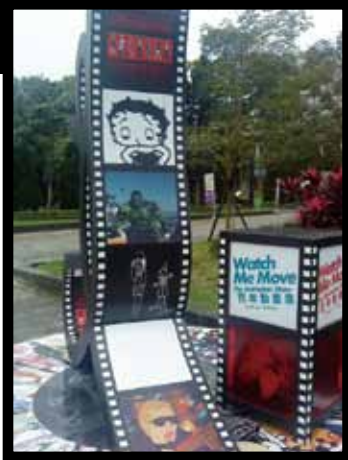
▲ 展覽場外的立體看板，在上頭可以看到許多經典的卡通人物

迫不及待也想去了嗎？不要猶豫了，走一趟中正紀念堂，你就可以展開一趟動畫歷史旅程。