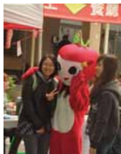
▲同學與蘋果英雄開心合影

今年在蘋果節系列活動中，學生會特別精心設計了許多有趣的闖關遊戲，像是「蘋果 DO RE MI」、「蘋果配對黏黏樂」、「蘋果投籃」、「蘋果肢體大考驗」等，讓大家更能參與這次的遊戲，增進同學間的交流，凝聚學生們的情誼。同時學生會也大放送，只要是前十五名完成全部闖關遊戲的同學，就可以得到神秘歌手的正版簽名CD乙張！另外更可以跟這次蘋果節的特別大使「蘋果英雄」免費合照一張拍立得，是不是很划算呢，參加過的同學都說真的是非常超值喔！