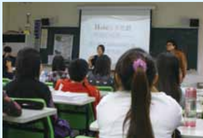
▲「憑什麼哥」、「Hold得住姐」與Mr. Google到班服務

想知道更多關於LiveDVD與多媒體資源嗎？讓「憑什麼哥」、「Hold得住姐」與Mr. Google到班為您服務。