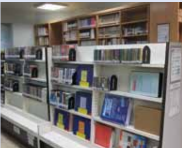
▲多媒體中心的影片種類非常豐富