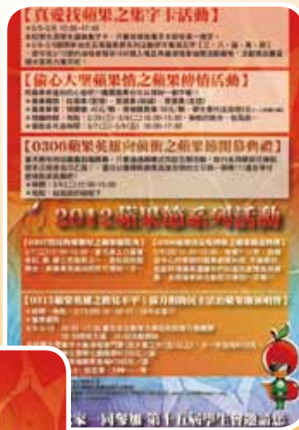
▲蘋果節系列活動的宣傳單