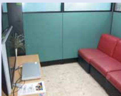
▲貼心的電影觀賞小空間