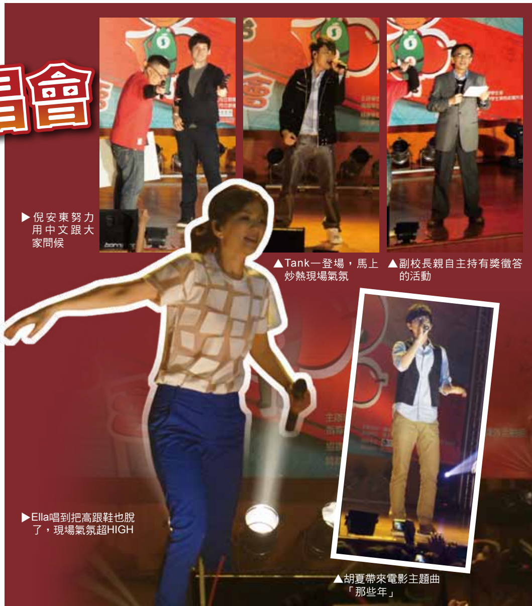
▶ 倪安東努力用中文跟大家問候

最後唱壓軸的就是Ella陳嘉樺囉，不愧是女子天團S.H.E的成員之一，在Ella準備登場前就看到好幾組媒體準備要拍攝，Ella一登場後就演唱她的新歌「壞女孩」，但Ella唱完之後卻屈膝緊抱她的腹部，似乎很痛苦的样子，Ella表示她非