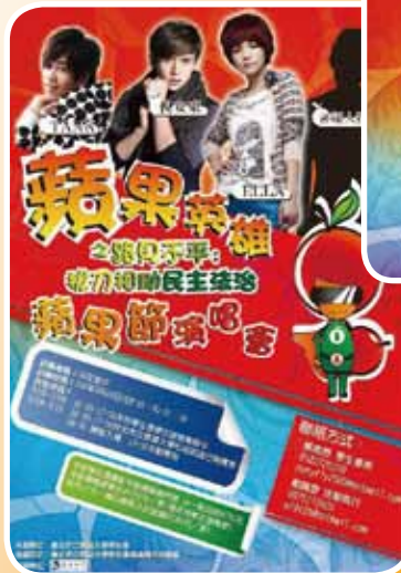
◀民主法治演唱會宣傳海報