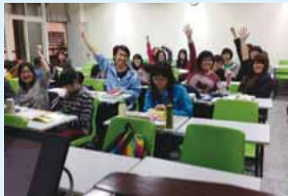
▲同學們對Live DVD的反應相當踴躍