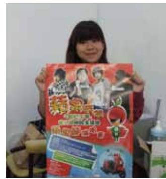
▲學生會感謝同學們熱情參與，希望大家繼續給予支持

Ans 學生會每一年都會重新找廠商，希望能找到品質好價錢又便宜的蘋果提供給大家。由於去年日本地震的關係影響到青蘋果的生產，今年找到的廠商都說青蘋果沒有來源，就算有也是冰了好幾個月冷凍品，只有外觀好看卻不好吃。原本學生會打算訂購市面上能買到的美國華盛頓青蘋果，但顧慮到沒事先提供資訊且恐怕不能兼顧往年品質，銷售不好使蘋果滯銷的話也是一種浪費，所以才臨時決定不販售青蘋果，這點確實是對同學比較抱歉。