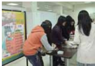
▲在地餐中舉辦的蘋果創意料理活動

如果還想跟蘋果英雄合照還有機會喲，只要在活動週身穿紅、黃、綠三色服裝之一，前往學生會的攤位就可以與蘋果英雄合照，讓蘋果英雄陪你度過蘋果節，留下美好的記憶！另外在三月八號當天學生會與健促中心更聯合舉辦「最後決定吃掉你之蘋果創意料理」活動，教你如何變化蘋果料理，讓蘋果不只可以像平常一樣切開來就吃，有更多豐富的變化，不僅特別又吃得健康！大家一起來發揮創意讓蘋果變得更好吃吧！