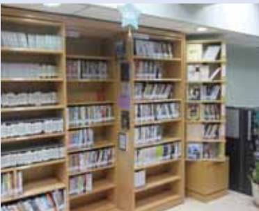
▲多媒體中心有許多當季的熱門影片可供觀看