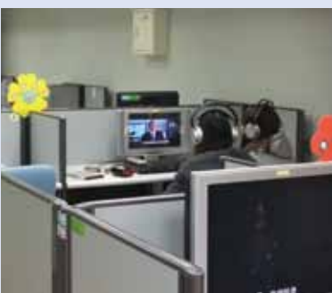
▲同學們正在使用多媒體資源