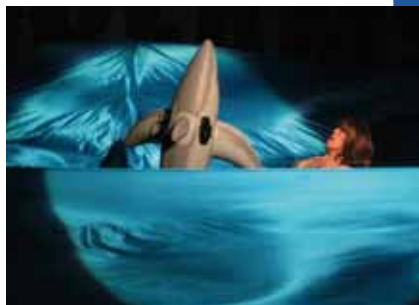
▲使用非常獨特的方式呈現游泳表演