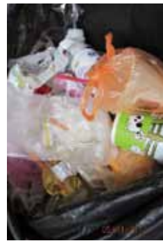
▲垃圾桶裡時常可見未分類的垃圾