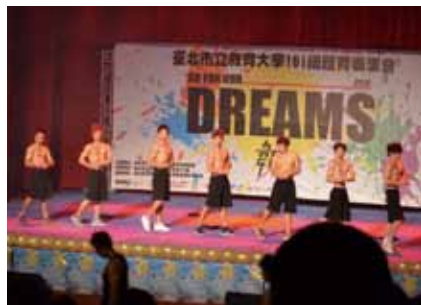
▲令現場所有女生們印象深刻且驚叫連連的肌肉猛男們