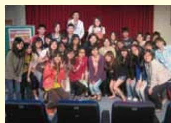
▲最後一場活動圓滿落幕大合影