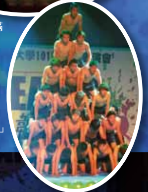
▶首先登場演出的「鐵男101 蛙人」