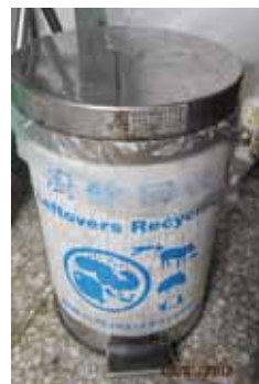
▲公誠樓、科學館等處都有放置廚餘回收桶

學校是個教育場所，更是培養學生生活習慣的重要環境。垃圾問題並非單方面的問題，而是仰賴學校的宣導與重視，以及學生的配合。唯有大家一起努力，才能真正落實綠色校園。