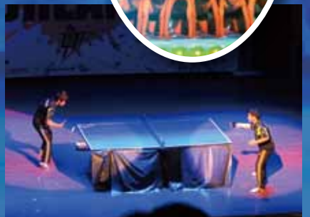
▲令人屏息觀賞的桌球表演