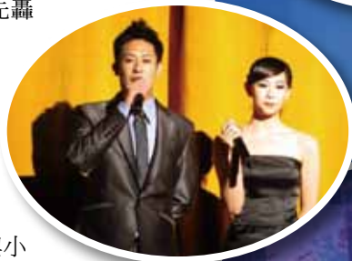
◀二位盛裝打扮、非常有氣質的主持人