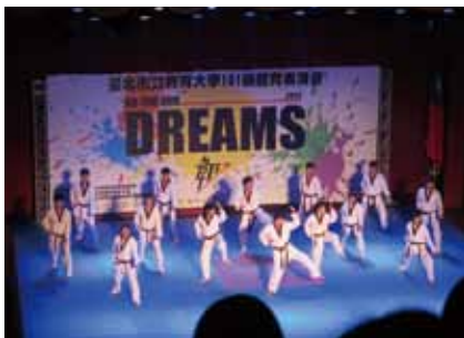
▲體表會中精彩的跆拳道表演