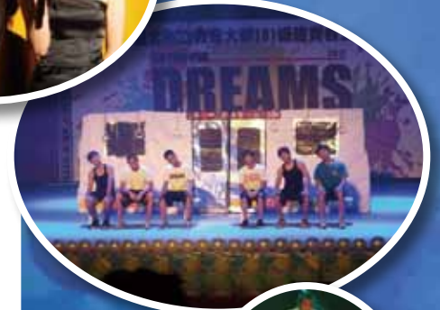
▲體表會中充滿創意的演出