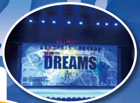
▲體表會充滿氣勢的舞台佈景

台上的表演者揮灑著汗水與淚水，觀眾們也抱以最熱烈的掌聲，劃破中正堂的屋頂。對許多觀眾來說，這是一個很精彩的夜晚，但對親自參與演出的體育系同學來說，今晚是人生中不可或缺的一頁，就像他們說的：「可以接受失敗，但不能接受放棄，藉由『韌』字傳達出意志堅定，不可動搖的心境。」