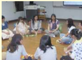
▲活動「挖挖我細項——能力大探索」團體成員分享

工團規劃許多職場關卡，讓來參加的同學們透過各種情境模擬，更了解真實的職場生態，並探索自己。除了面試的場合，也有在餐廳擔任服務生被客人抱怨的情境，可說是非常寫實及生活化。每關關主精心安排各種測試情境，而參加者們表現也令人驚豔，看來本校同學臨場反應都相當的不錯呢！