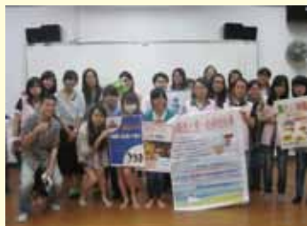
▲活動「情境模擬——假戲真做ACTION」歡樂大合影

工團規劃許多職場關卡，讓來參加的同學們透過各種情境模擬，更了解真實的職場生態，並探索自己。除了面試的場合，也有在餐廳擔任服務生被客人抱怨的情境，可說是非常寫實及生活化。每關關主精心安排各種測試情境，而參加者們表現也令人驚豔，看來本校同學臨場反應都相當的不錯呢！