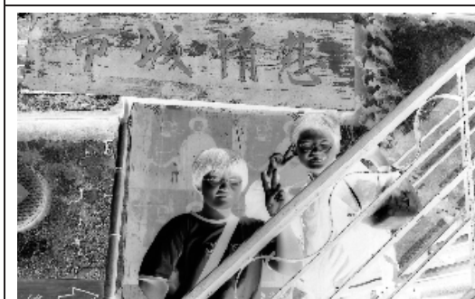
讓九份聲名大噪的悲情城市