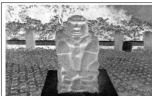
從頌德公園礦工石雕看九份興衰