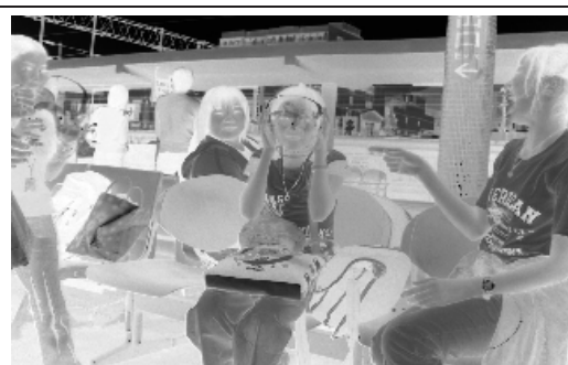
自行規劃的旅遊活動讓大家更開心